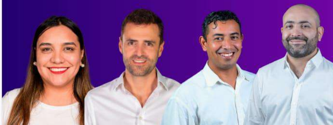
JORGELINA KOKY JUÁREZ DIPUTADA PROVINCIAL