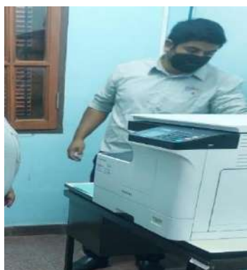
Adquisición de una fotocopidora y de diccionarios de inglés

Es "mimo" para la comunidad educativa poder avanzar día a día en la adquisición de elementos necesarios para el buen funcionamiento del establecimiento. Cabe mencionar que todo lo adquirido es para el uso de los estudiantes y docentes; quiénes toman la responsabilidad de cuidar los materiales de trabajo.