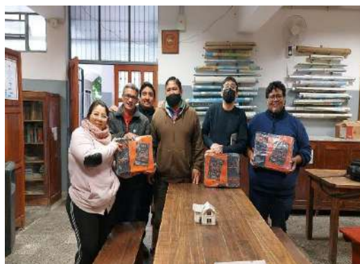
Cajas de herramientas para PP.